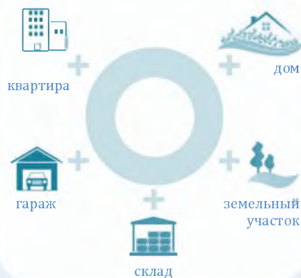
Схема 2. Недвижимое имущество

в) дачный земельный участок - земельный участок, предоставленный гражданину или приобретенный им в целях отдыха (с правом возведения жилого строения без права регистрации проживания в нем или жилого дома с правом регистрации проживания в нем и хозяйственных строений и сооружений, а также с правом выращивания плодовых, ягодных, овощных, бахчевых или иных сельскохозяйственных культур и картофеля).